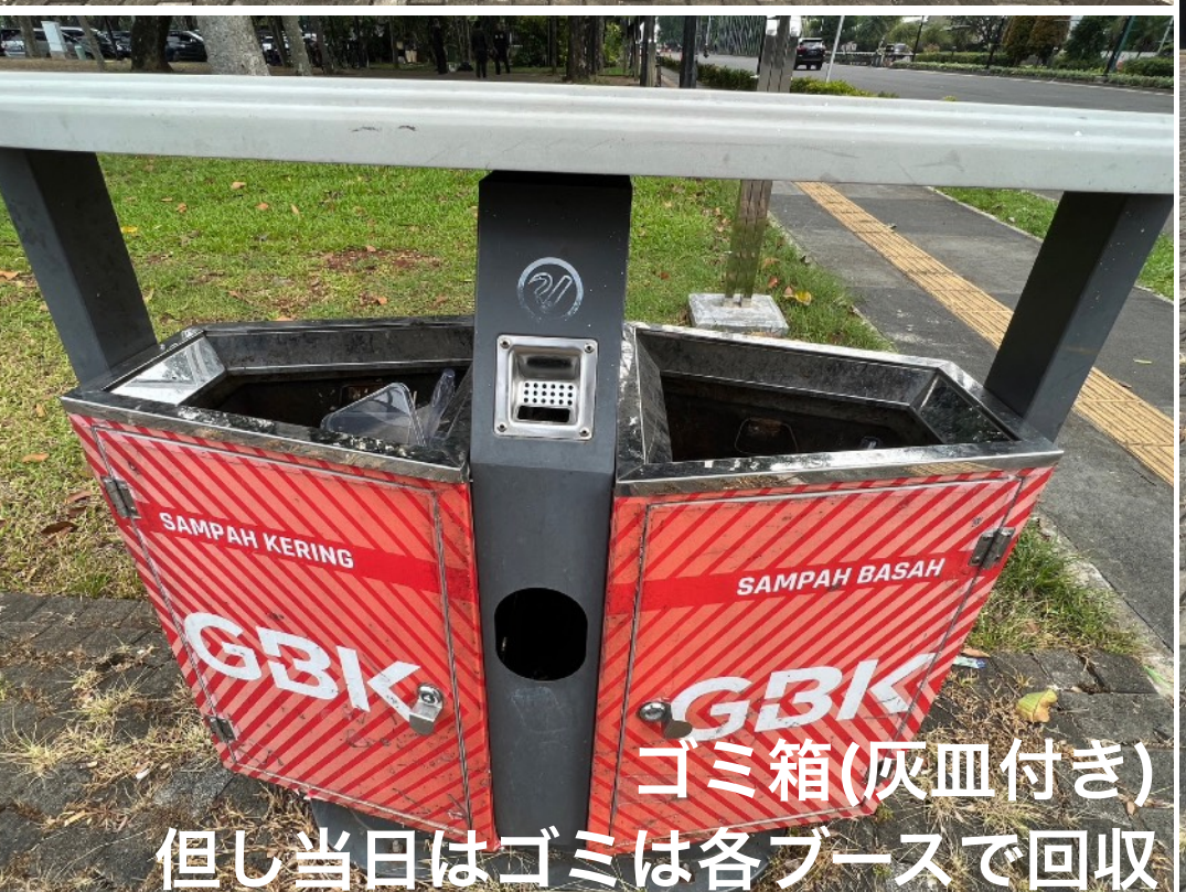
ゴミ箱(灰皿付き) 但し当日はゴミは各ブースで回収