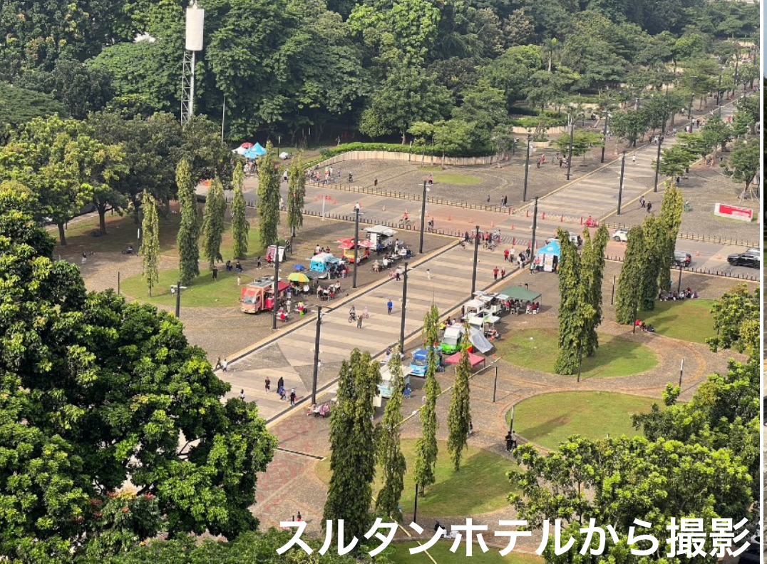
スルタンホテルから撮影