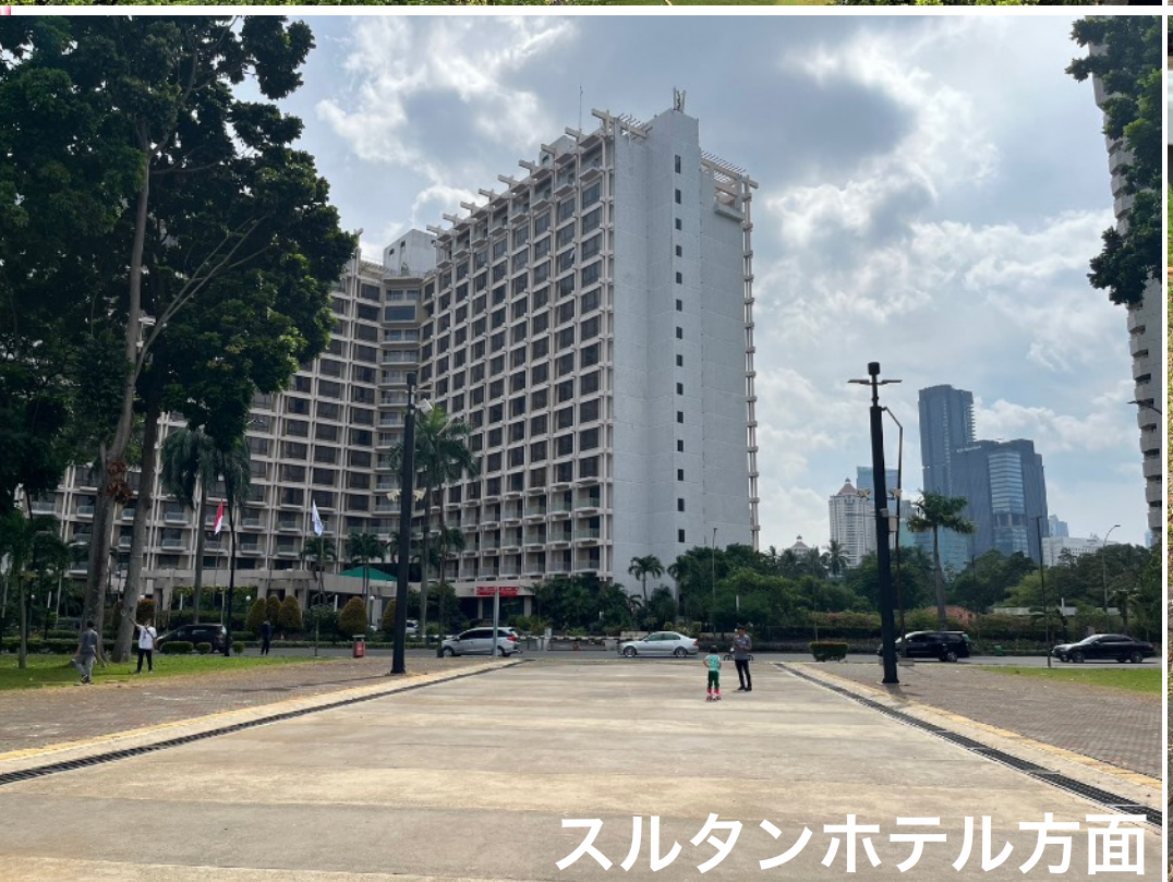
スルタンホテル方面